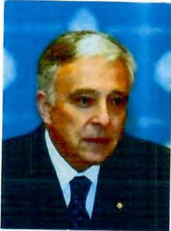
Academician Mugur Constantin Isărescu

Data nașterii: 1 august 1949 Locul nașterii: Drăgășani, jud. Vâlcea